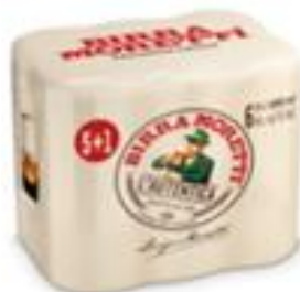
Birra Moretti L'autentica pachet 5+1 gratis-doza 0.5l