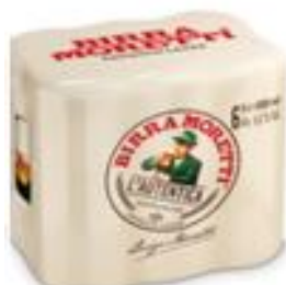
Birra Moretti L'autentica pachet 6 produse doza 0.5l