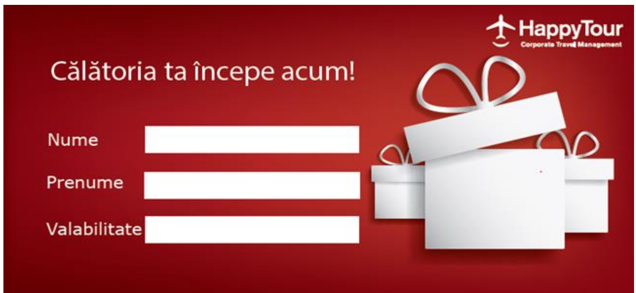
Voucher Happy Tour

* Imaginile premiilor sunt cu titlu de prezentare