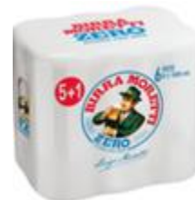
Birra Moretti Zero pachet 5+1 gratis - Doza 0.5l