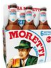
Birra Moretti Zero pachet 5+1 gratis - Sticla 0.33l