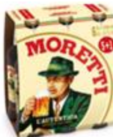
Birra Moretti L'autentica pachet 5+1 gratis-Sticla 0.5l