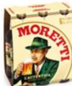
Birra Moretti L'autentica pachet 6 produse-Sticla 0.5l