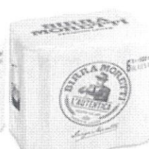
Birra Moretti L'autentica pachet 6 produse doza 0.5l