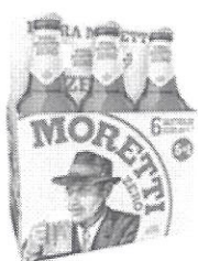
Birra Moretti Zero pachet 5+1 gratis – Sticla 0.33 l