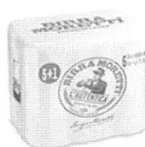
Birra Moretti L'autentica pachet 5+1 gratis doza 0.5l