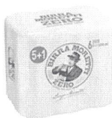
Birra Moretti Zero pachet 5+1 gratis – Doza 0.5l