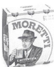
Birra Moretti L'autentica pachet 6 produse – Sticla 0.5l