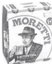
Birra Moretti L'Autentica pachet 5+1 gratis –Sticla 0.5l