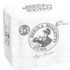
Birra Moretti Zero pachet 5+1 gratis –Doza 0.5l