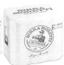
Birra Moretti L'Autentica pachet 6 produse doza 0.5l