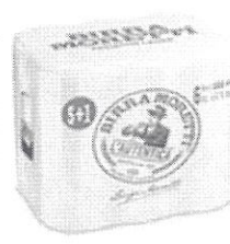
Birra Moretti L'Autentica pachet 5+1 gratis doza 0.5l