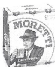
Birra Moretti L'Autentica pachet 6 produse –Sticla 0.5l