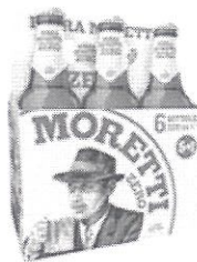
Birra Moretti Zero pachet 5+1 gratis – Sticla 0.33 l