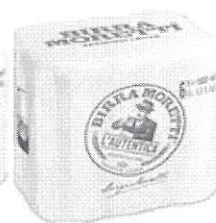
Birra Moretti L'autentica pachet 6 produse doza 0.5l