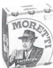
Birra Moretti L'autentica pachet 6 produse –Sticla 0.5l