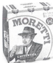
Birra Moretti L'autentica pachet 5+1 gratis –Sticla 0.5l