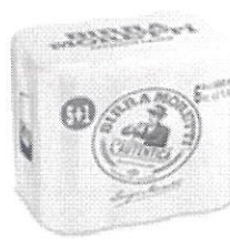
Birra Moretti L'autentica pachet 5+1 gratis doza 0.5l