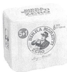
Birra Moretti Zero pachet 5+1 gratis –Doza 0.5l