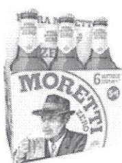
Birra Moretti Zero pachet 5+1 gratis – Sticla 0.33 l