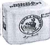
Birra Moretti L'autentica pachet 6 produse doza 0.5l