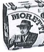
Birra Moretti L'autentica pachet 5+1 gratis -Sticla 0.5l