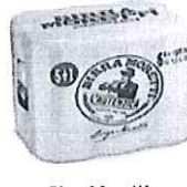
Birra Moretti L'autentica pachet 5+1 gratis doza 0.5l