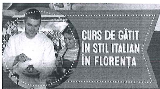
Curs de gatit in stil Italia in Florenta