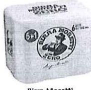
Birra Moretti Zero pachet 5+1 gratis -Doza 0.5l