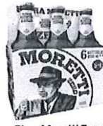
Birra Moretti Zero pachet 5+1 gratis - Sticla 0.33 l