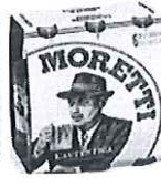
Birra Moretti L'autentica pachet 5 produse -Sticla 0.5l