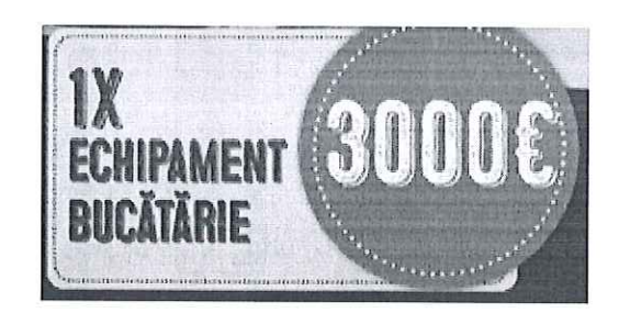
Voucher Echipament bucatarie - ProCucina