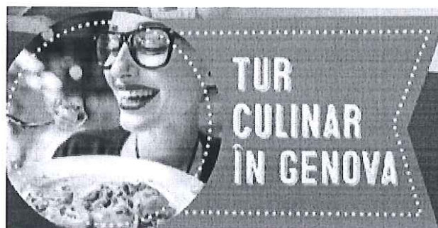
Tur culinar in Genova