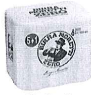
Birra Moretti Zero pachet 5+1 gratis -Doza 0.5l