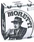
Birra Moretti L'autentica pachet 6 produse -Sticla 0.5l