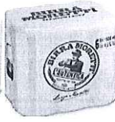
Birra Moretti L'autentica pachet 6 produse doza, 0.5l