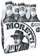
Birra Moretti Zero pachet 5+1 gratis - Sticla 0.33 l