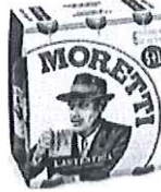
Birra Moretti L'autentica pachet 5+1 gratis -Sticla 0.5l