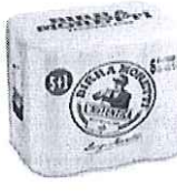
Birra Moretti L'autentica pachet 5+1 gratis doza, 0.5l