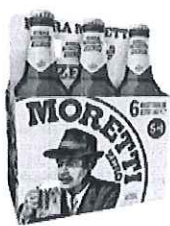
Birra Moretti Zero pachet 5+1 gratis - Sticla 0.33l