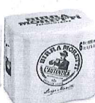
Birra Moretti L'autentica pachet 6 produse doza 0.5l