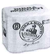
Birra Moretti L'autentica pachet 5+1 gratis doza 0.5l