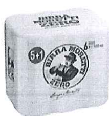
Birra Moretti Zero pachet 5+1 gratis - Doza 0.5l