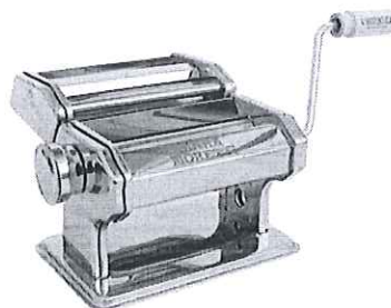
Masina de facut paste

*Imaginile premiilor sunt cu titlu informativ