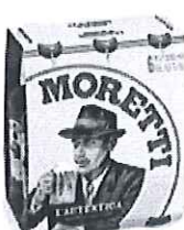
Birra Moretti L'autentica pachet 6 produse - Sticla 0.5l