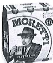
Birra Moretti L'autentica pachet 5+1 gratis - Sticla 0.5l