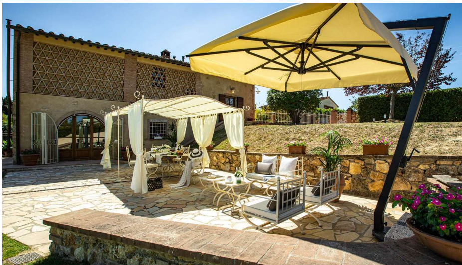
Experienta turistica la vila in Toscana