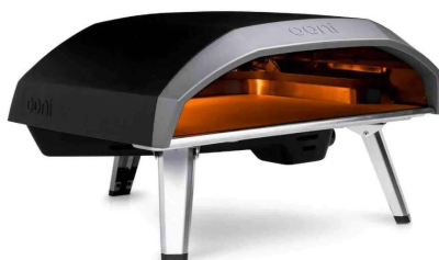
Cuptor pizza OONI

*Imaginile premiilor sunt cu titlu informativ