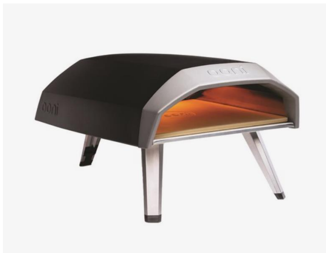
Cuptor pizza OONI Koda 12