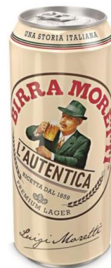
Doza de bere Birra Moretti® L'autentica

*Imaginile premiilor sunt cu titlu informativ